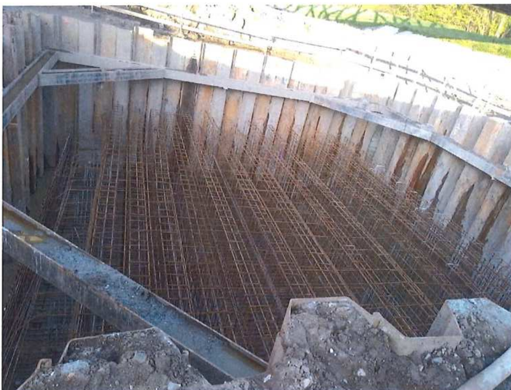
Armovanie základu piliera P2 CZ strana – SO 12-33-04