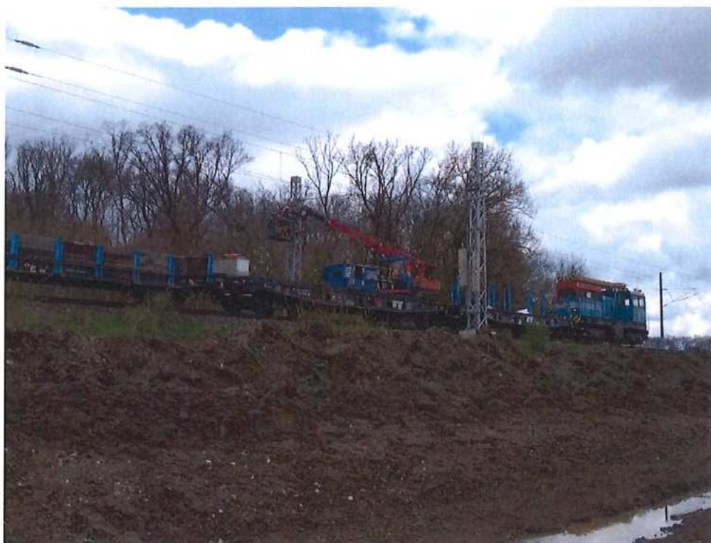
Realizácia napájacích prevesov v novom elektrickom delení pri štátnej hranici