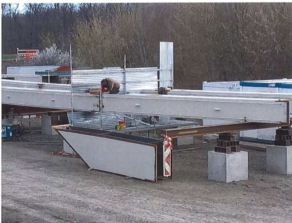
Predmontáž oblúkov mosta na pomocnej platforme – SO 12-33-04