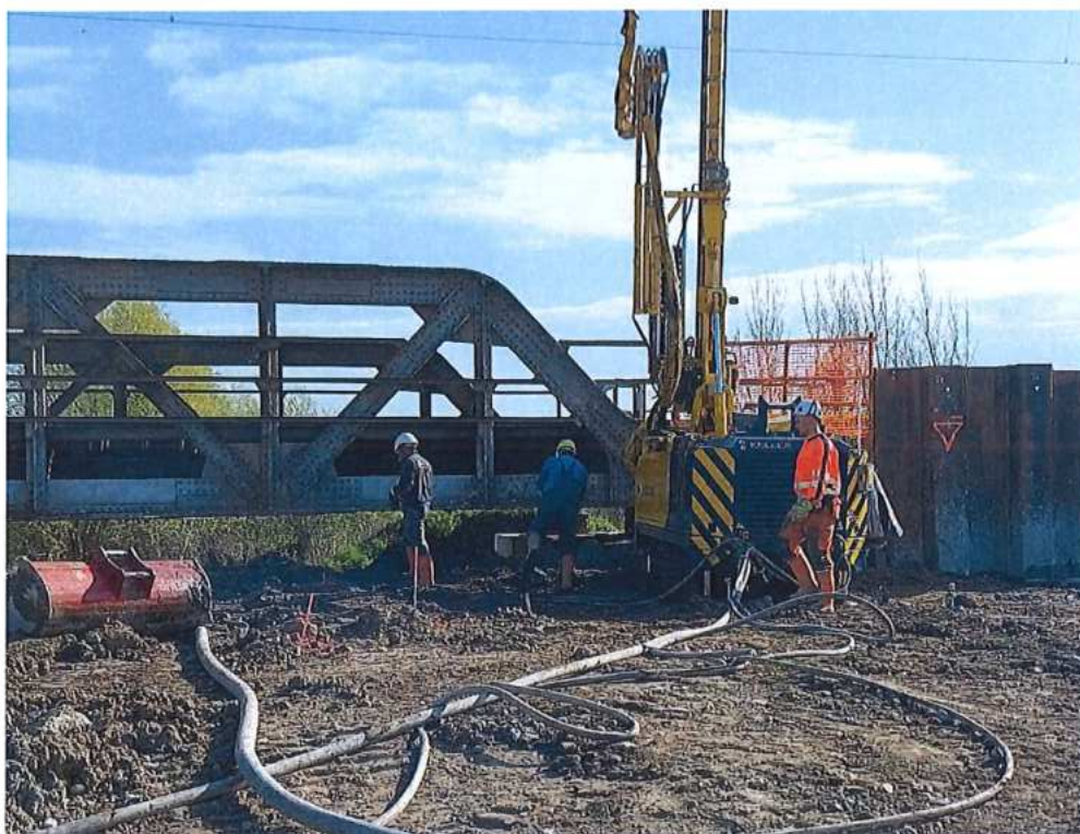
Trysková injektáž opory mosta SO 12-33-01