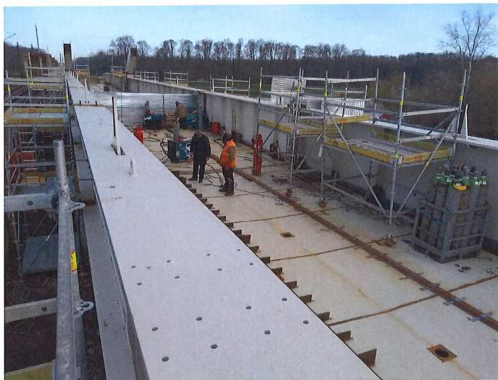
Montáž oceľovej konštrukcie mosta – SO 12-33-04