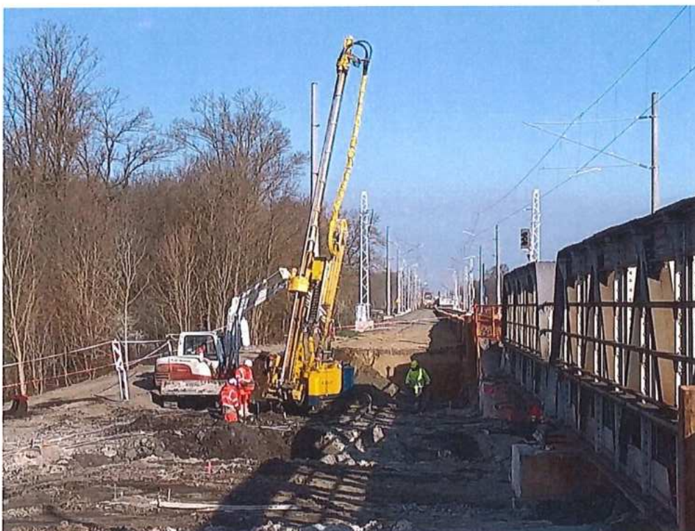
Trysková injektáž opory mosta – SO 12-33-02