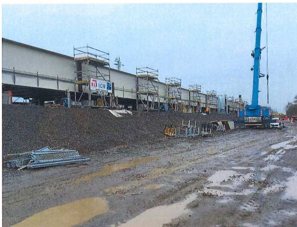
Montáž oceľovej konštrukcie mosta SO 12-33-04