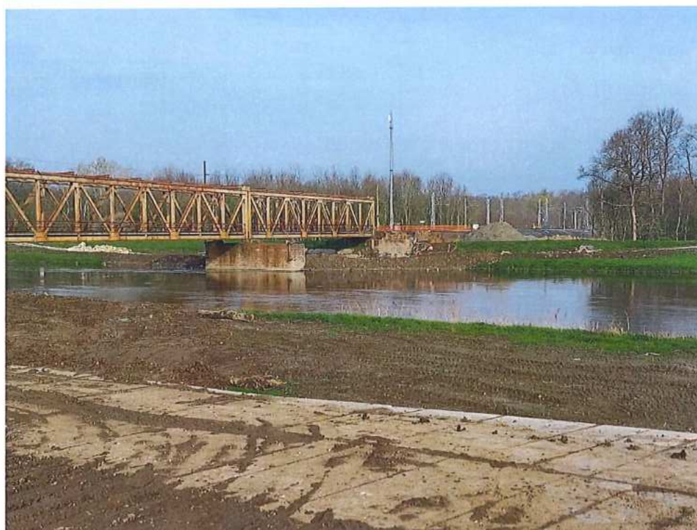
Terénne úpravy bermy SK strana pri SO 12 -33-04