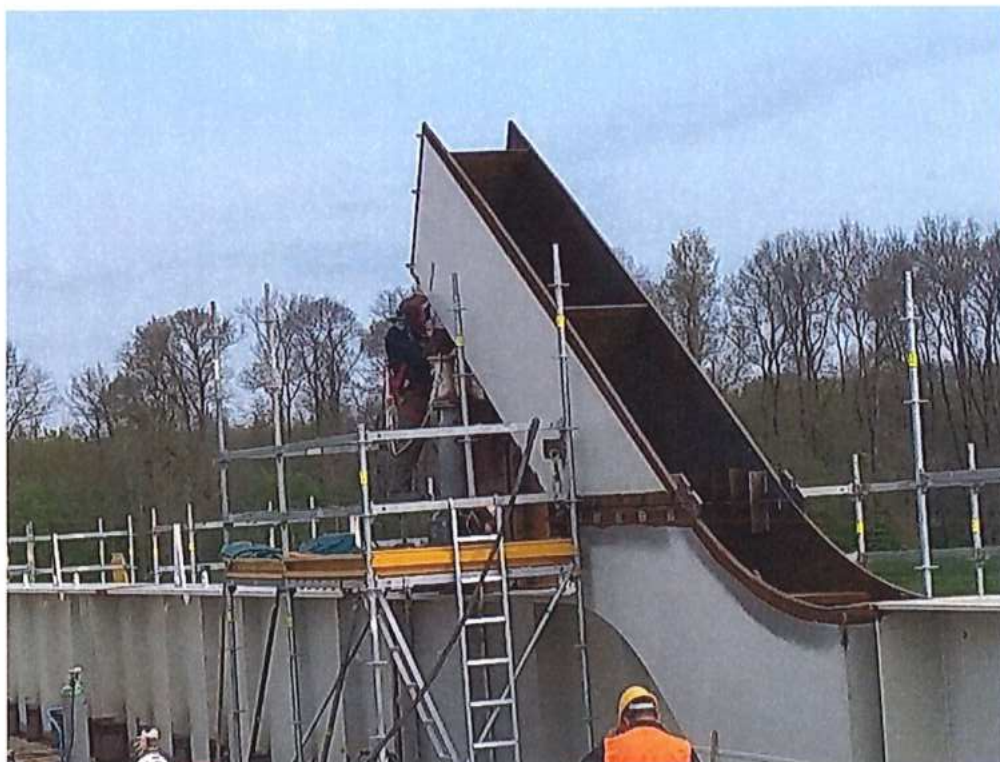
Montáž ocelovej konštrukcie mosta SO 12-33-04