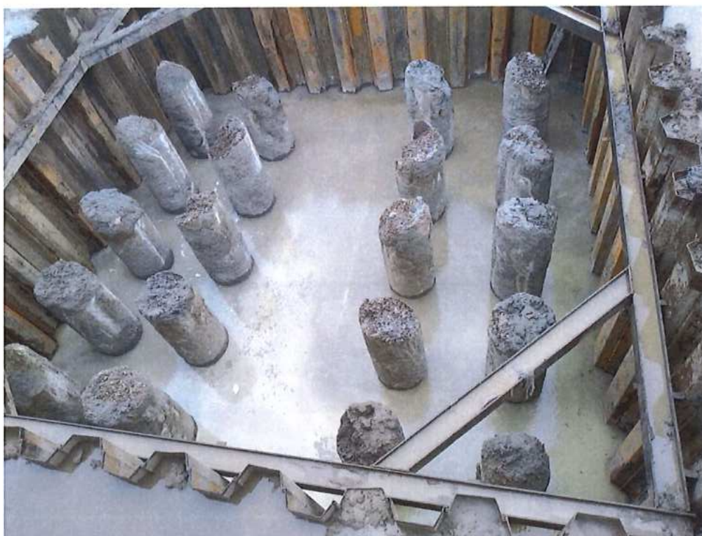
Podkladný betón základu piliera P2 CZ strana SO 12-33-04