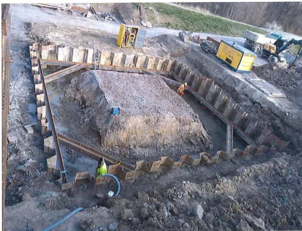
Zriadenie rozperného rámu na štetovnicovej stene pilier P2 strana CZ – SO 12-33-04