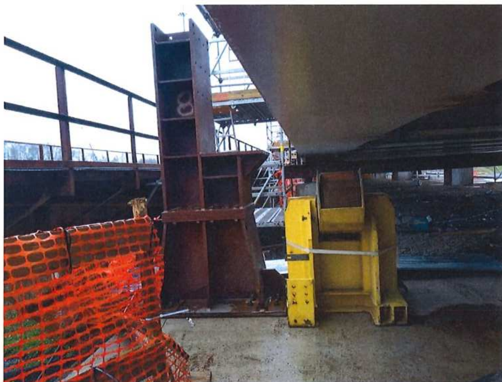
Príprava výsuvného mechanizmu mosta SO 12-33-04