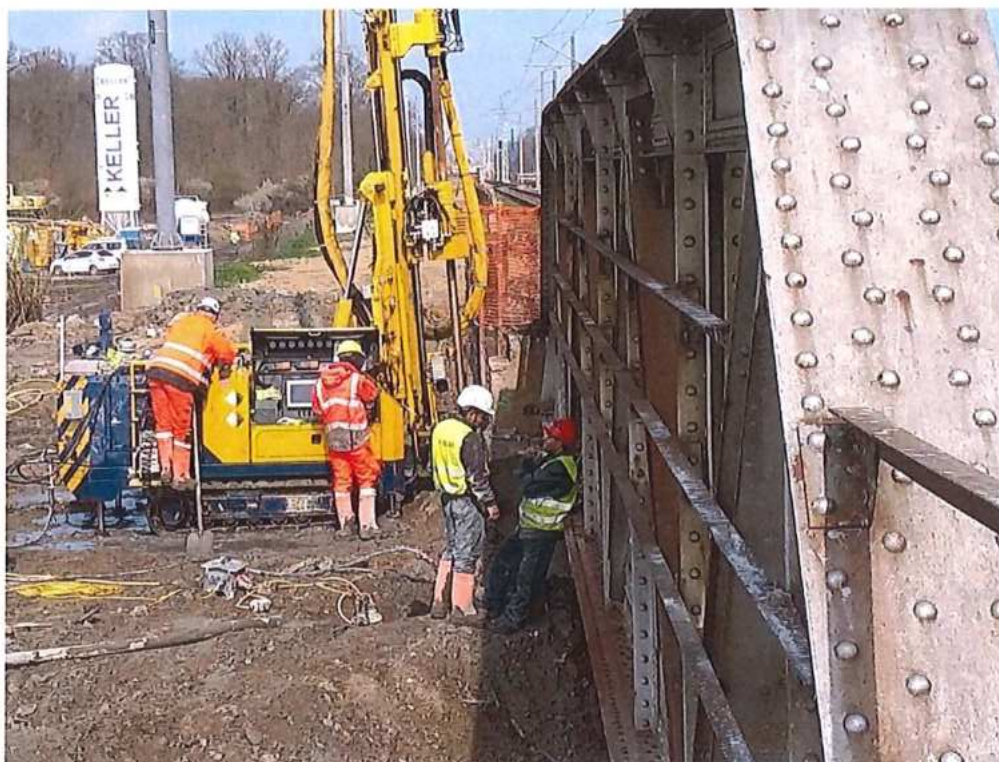
Trysková injektáž opory mosta SO 12-33-01