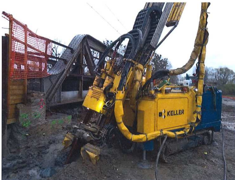
Trysková injektáž opory mosta SO 12-33-02