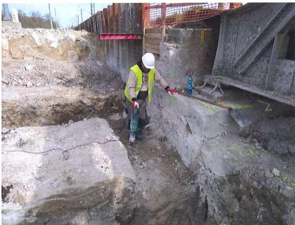
Búranie opôr mosta v km 73,210 – SO 12-33-01