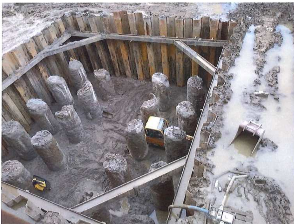
Výkop pre vybudovanie piliera P2 na CZ strane SO 12-33-04